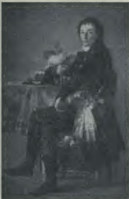
F. P. M. D. Guillemardet, conventionnel, ambassadeur de la République française.

Godoy lui-même reste à la Cour et voit chaque jour les souverains. Sa retraite est d'abord si peu un désastre, qu'un cortège considérable l'accompagne quand il quitte le Palais-Royal. Zinoviev, qui constate cette intimité, est convaincu que si le prince de la Paix avait consenti à renvoyer Josefa Tudo, Saavedra était balayé. Quelles que fussent les intrigues qu'il put avoir liées avec la reine, tout aurait été oublié et le nouveau favori Mallo, qui avait reçu à la Cour un emploi correspondant à celui de gentil-